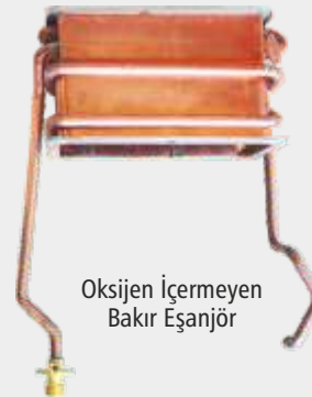
Oksijen İçermeyen Bakır Eşanjör